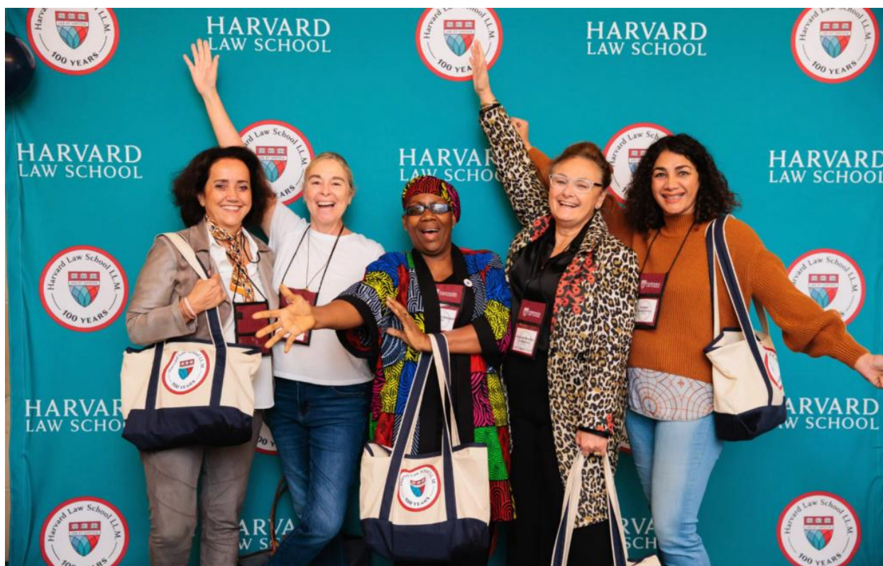
Membres du comité juridique d'Albatross et de Create2donate