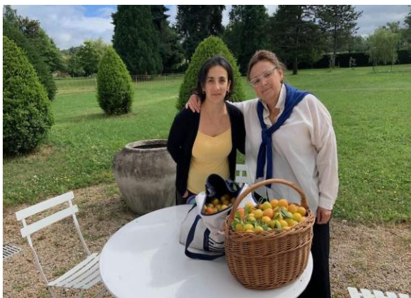
Récoltes de légumes et fruits du jardin pédagogique