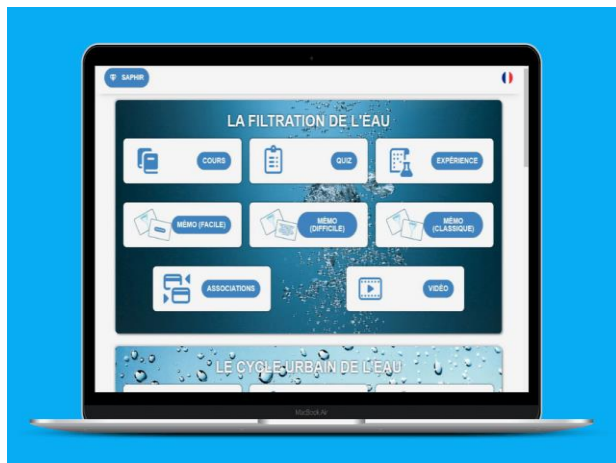
Module sur la thématique Eau

Pour ses activités, Albatross a reçu l'Innovation Award du CF du MEDEF et le Trophée de la Fondation du Roi Baudouin.