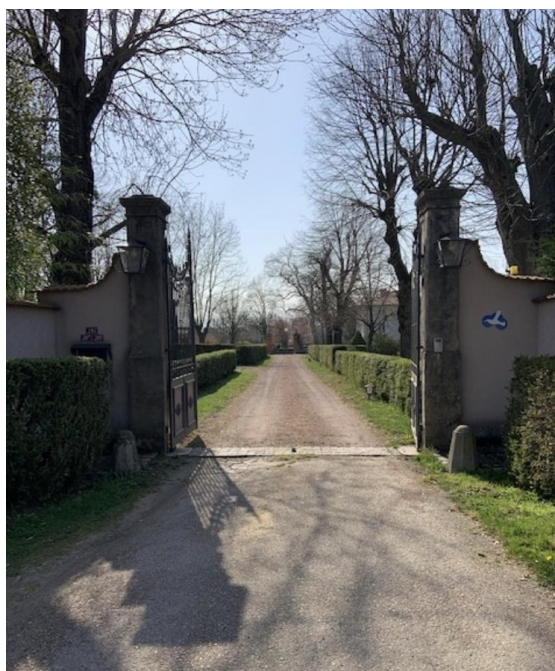
Entrée des Albahomes