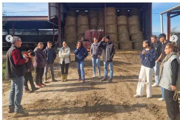
Elevage durable avec l' EMLyon

L'Ecole de Commerce EMLyon et le Lycée du Forez ont signé des accords de coopération avec Albatross pour permettre aux jeunes d'assister aux formations gratuites du Jardin de Servan.