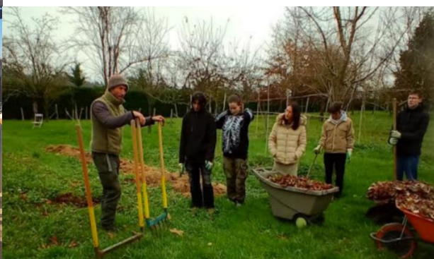
Hivernage du sol avec le lycée du Forez