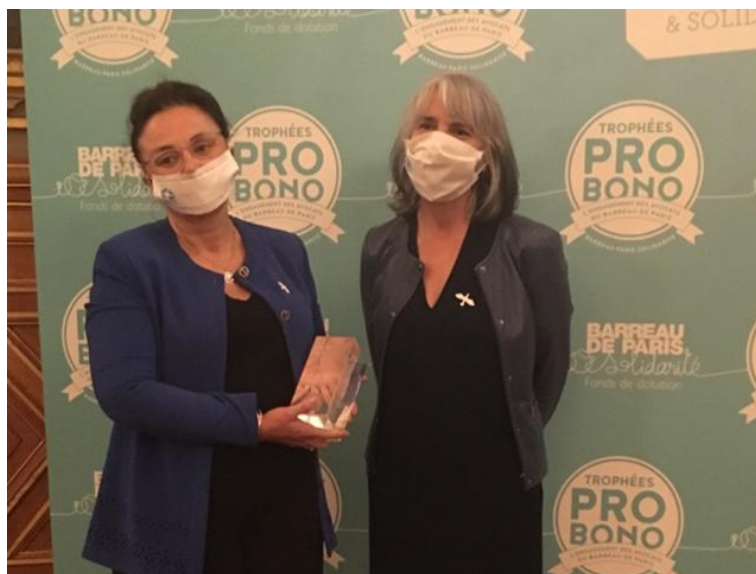
Trophée Probono du Barreau de Paris à Albatross Legal