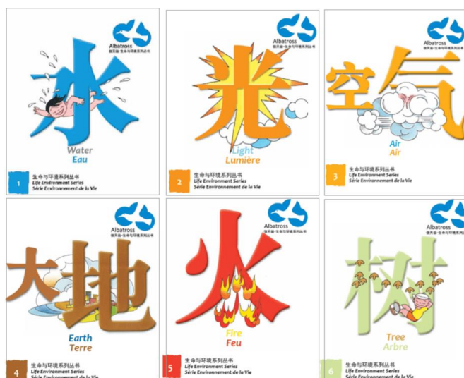
6 livres sur l'Environnement, Collection Albatross Life Environnement (20 livres)