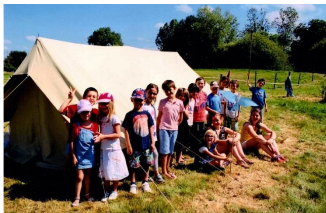
AlbaCamps avec l'Ecole de Violay