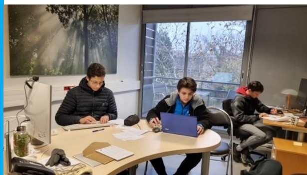
Stage de lycéens pour étude de Saphir