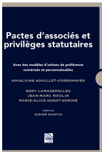
Edition Décembre 2024